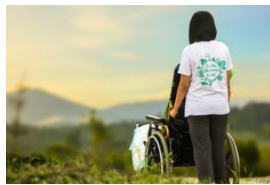
Zorg, welzijn en wonen